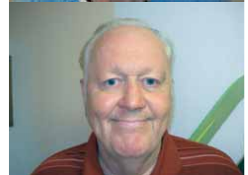
Die Senioren beim „Casting“